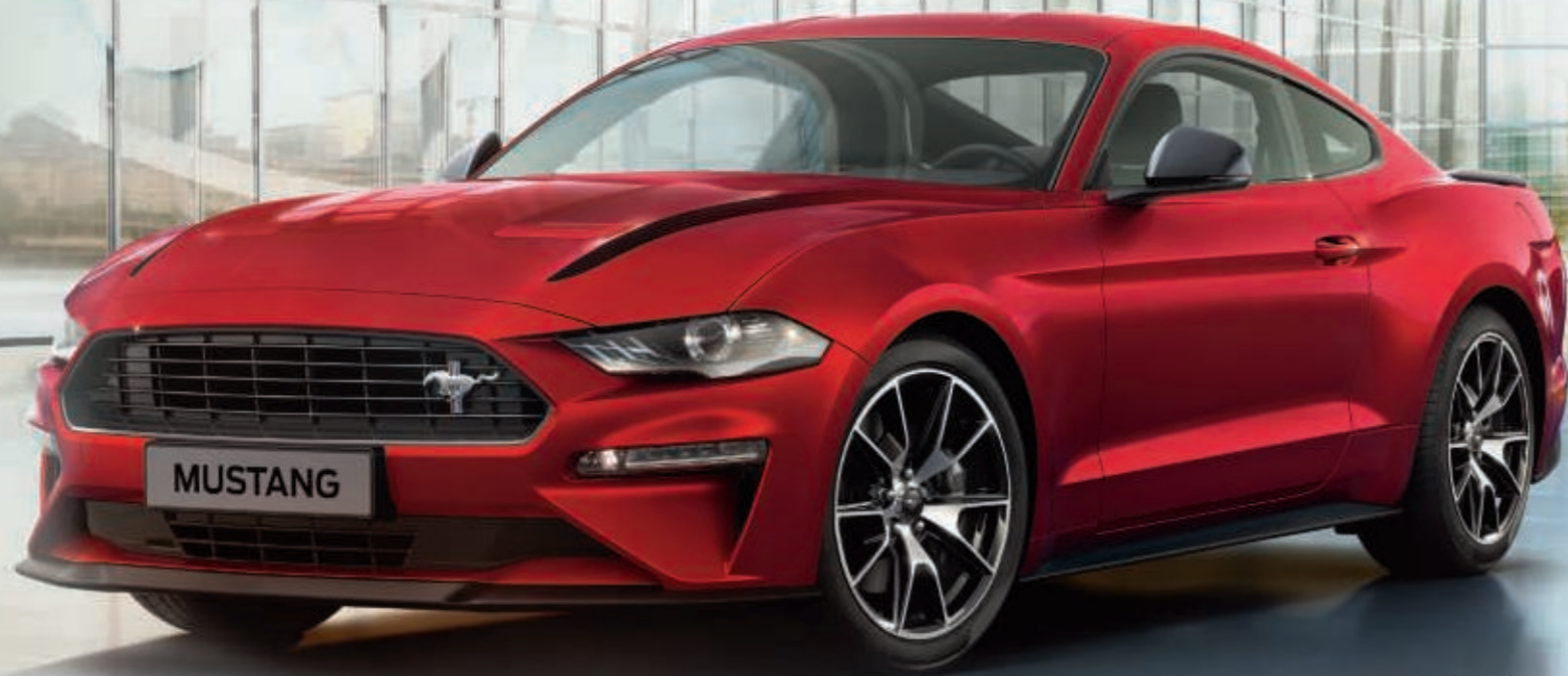
Mustang EcoBoost Fastback in colore carrozzeria perlescente Premium Los Angeles Red (optional) con cerchi in lega da 19" design a 5 razze a V con finitura nero cromata.