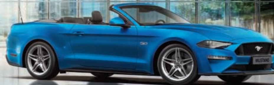
Mustang GT Convertible in colore carrozzeria metallizzato Miami Blue (optional) con cerchi in alluminio forgiato da 19" design a 5x2 razze Luster Nickel (contenuto in un pack optional per GT).